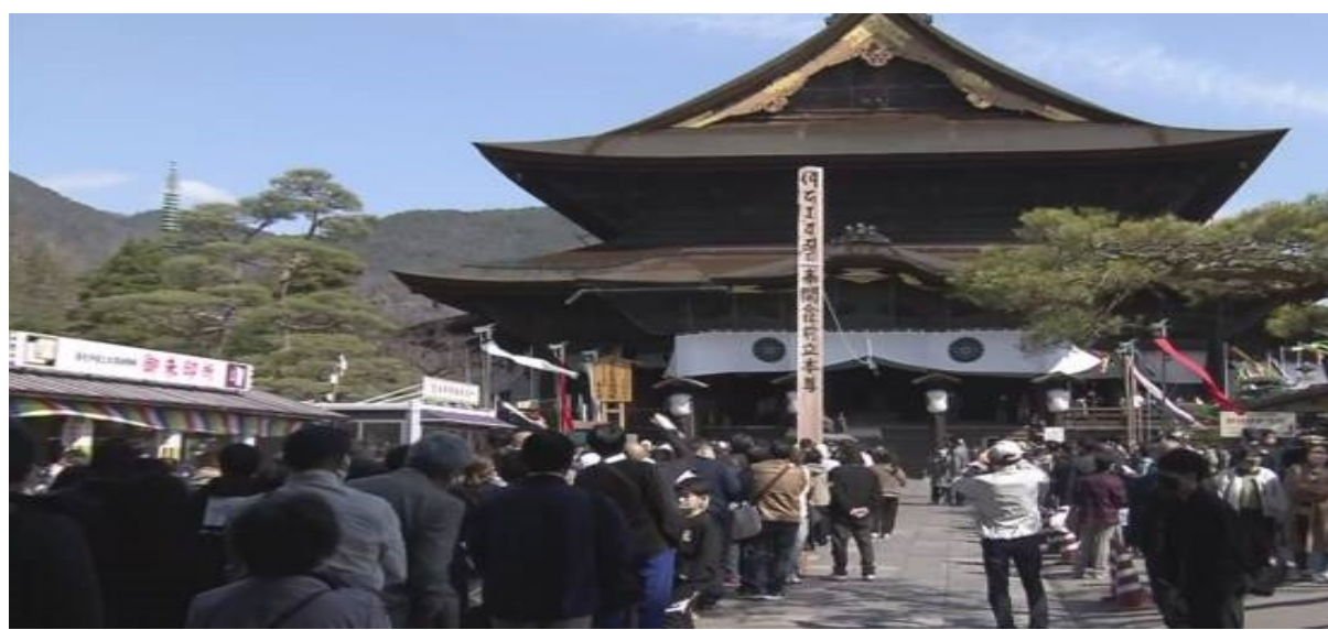
疫病退散を祈って8年振りに開催中の信州善光寺の御開帳にて

会計事務所様・税理士事務所様より委託を受け、領収書の仕訳や Excel・会計ソフトへのデータ入力代行業務、伝票整理業務などを行っています。簿記有資格者や知識のあるスタッフ、利用者で作業を行い、勘定科目の仕訳なども行っています。